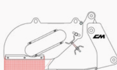
Modelo com kit pinças